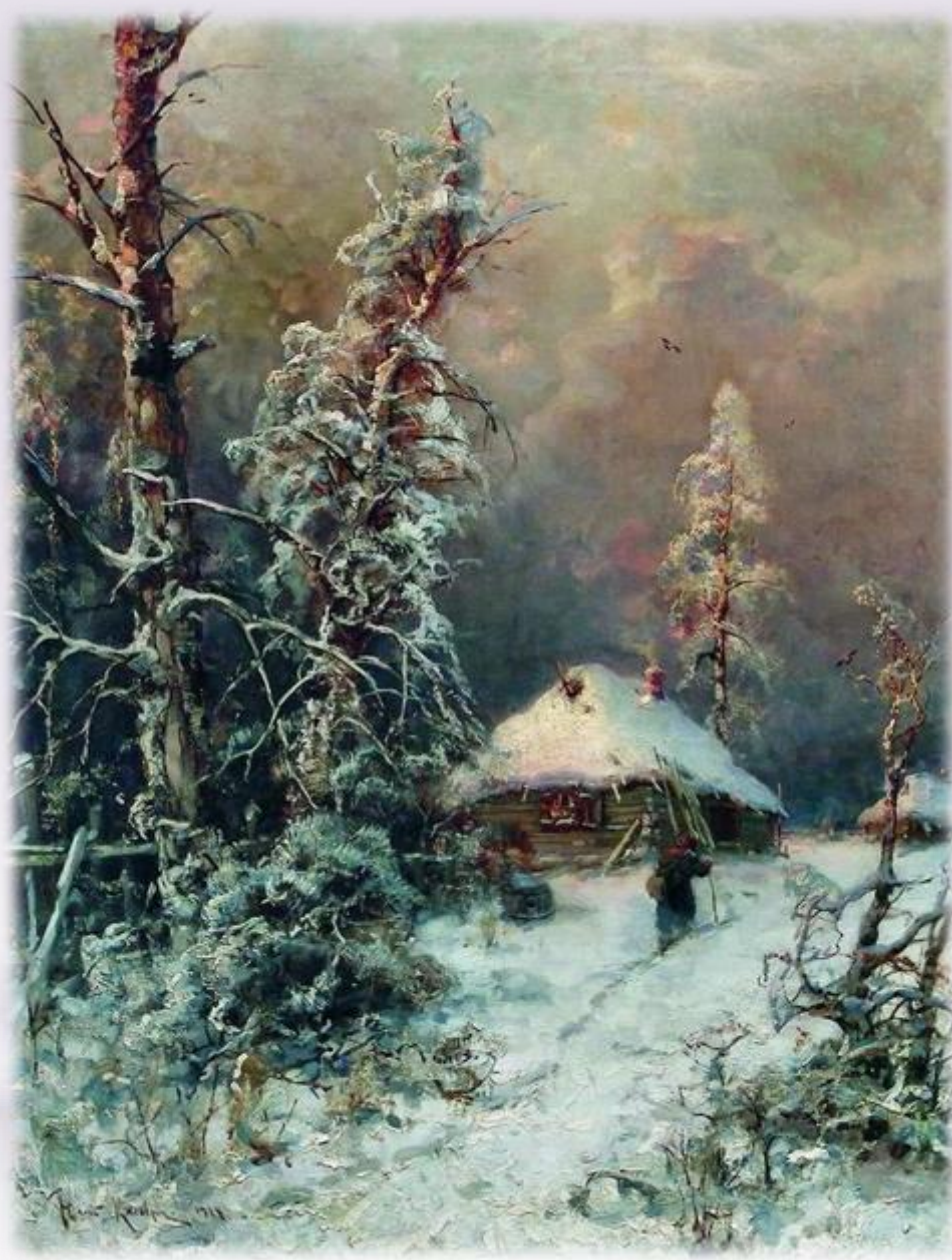
Ю. Клевер. Зимний пейзаж с домом