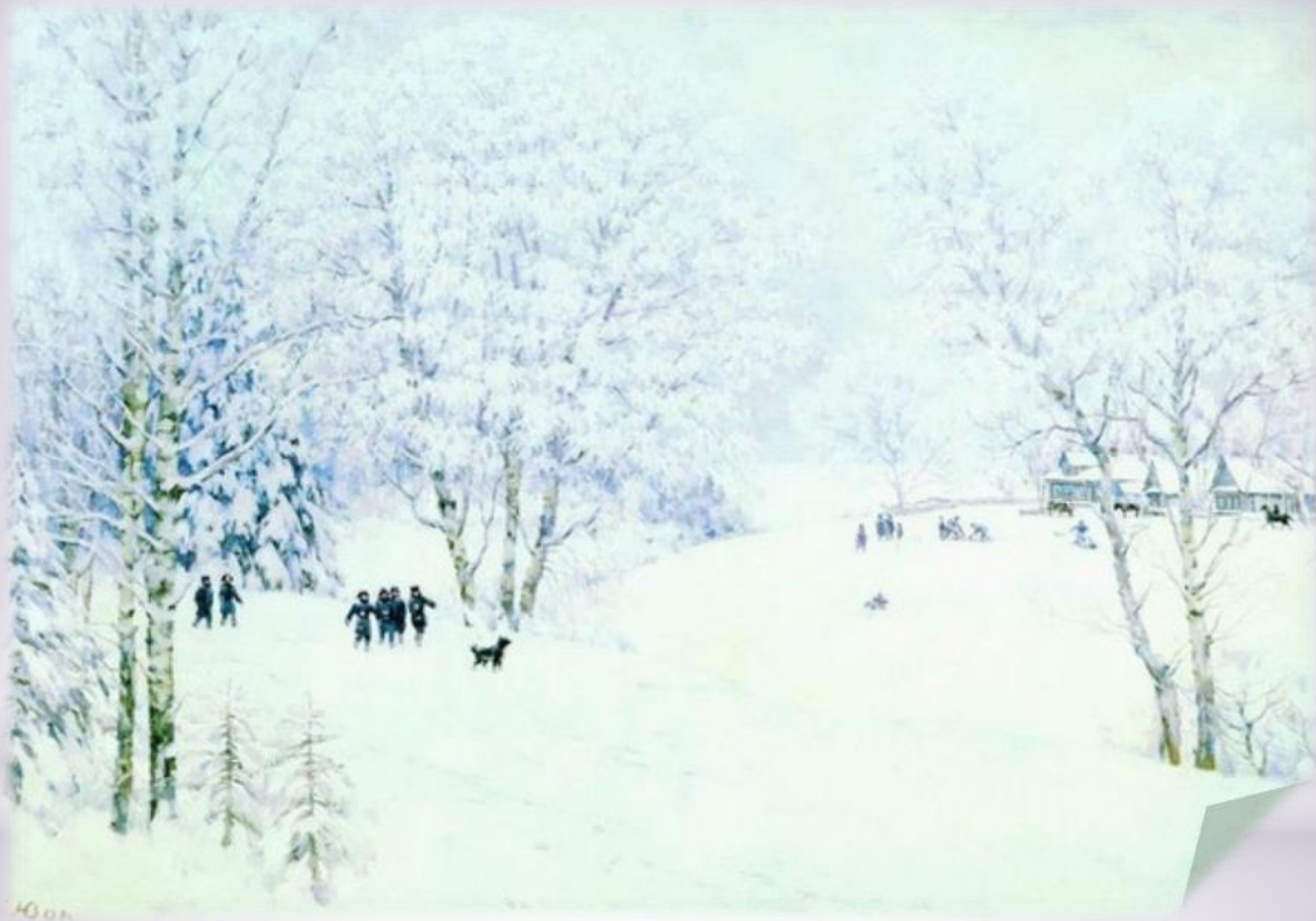
К.Юон. Русская зима. Лигачево. Фрагмент.