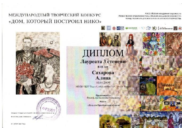
«Далеко в горах Грузии...», гуашь